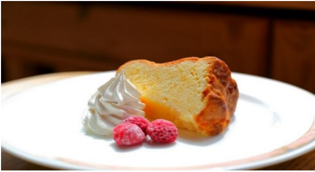
バターケーキ Butter Cake